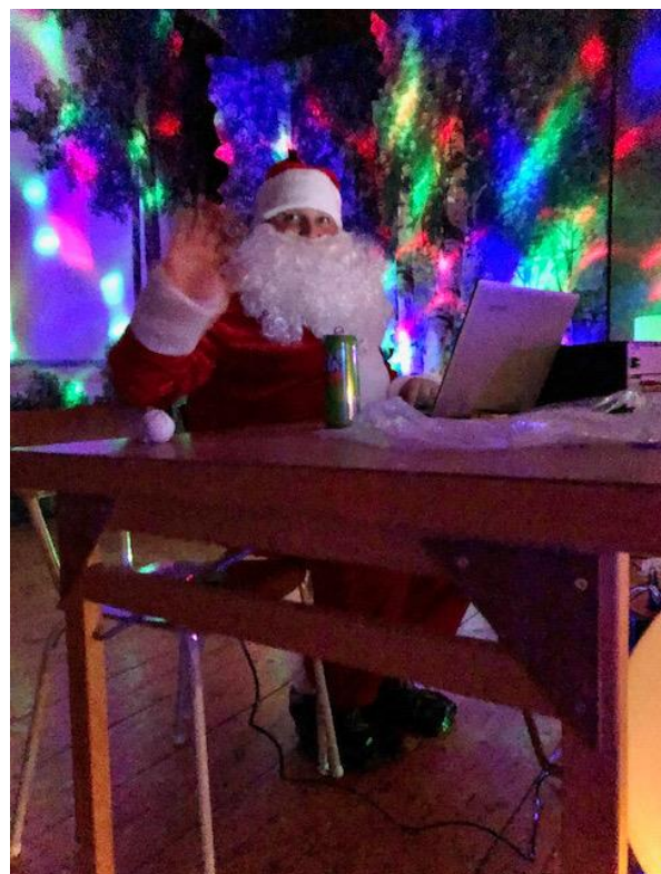
Tomten kom på besök redan till Halloween

En mysig tillställning med halloween utsmyckningar, skänkta av Ica Maxi och varor skänkta av Grevgott.