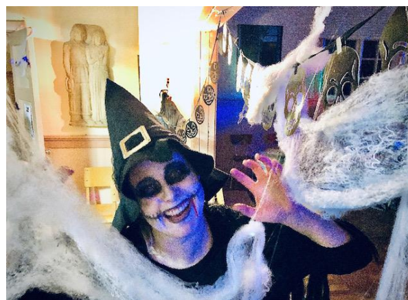
En riktigt ruggig kväll....