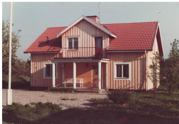
Bjurkär har genomgått en förändring