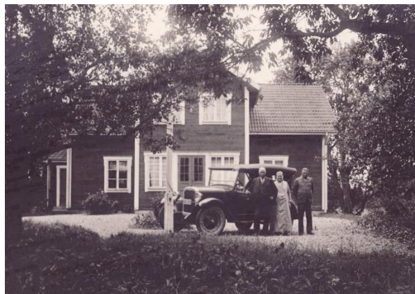
Bjurkär i mitten av 1800-talet