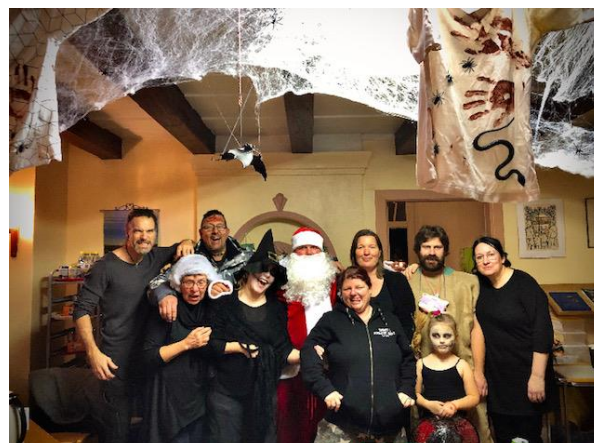
Här är vi som "fixat"