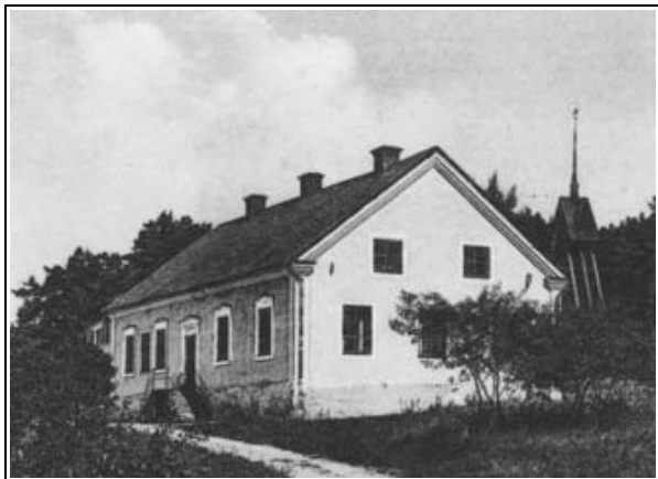
Kyrkskolan i Barva 1870-tal

Barva Framtid, ideell förening bildades för att bli ett paraply, dels för de arbetsgrupper som bildades i juni –98, dels för de föreningar som redan fanns. Inte för att blanda sig i den verksamhet som föreningarna bedriver utan för att vara en hjälp för att kunna utveckla bygden.