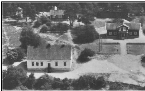
Barva skolan 1950-tal

År 1995 var Barva skolanedläggningshotad p.g.a. ekonomiska bekymmer inom vår kommun del Kafjärden-Skiftinge.